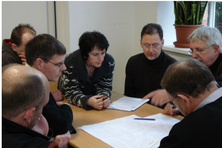
Kleingruppendiskussion in der Phantasiephase

In der Phantasiephase geht es darum, eine mögliche - wenn auch utopische - Zukunftsvision zu entwickeln. Der Phantasie sind keine Grenzen gesetzt. Im Gegenteil, die Idee von Robert Jungk war es, mit dieser Phase die Phantasie anzuregen und ihren Einsatz auch außerhalb der Zukunftswerkstatt zu fördern.