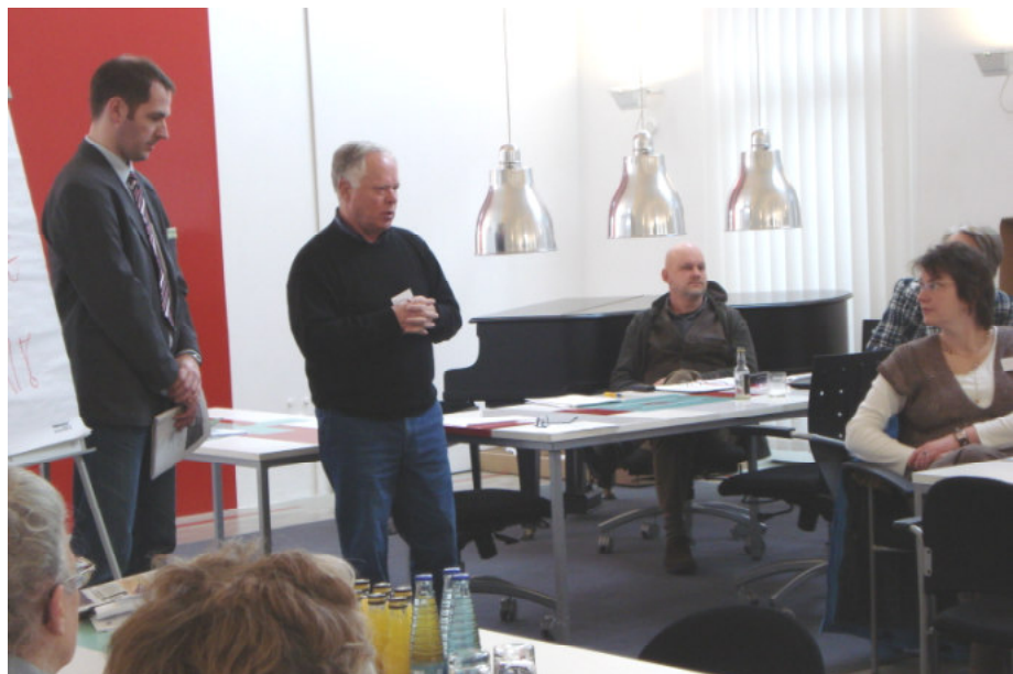
Impulsreferat im Planungszirkel

In der zweiten Stufe des Planungszirkels wird, analog zum Verfahren Planungszelle, sachorientiert an einer Optimierung der Vorschläge aus der Zukunftswerkstatt gearbeitet. Es geht darum, die in der Realisationsphase der Zukunftswerkstatt entwickelten Möglichkeiten einer kritischen Kontrolle zu unterziehen. Dazu werden Experten und Betroffenenvertreter zu den einzelnen Ideen gehört. Deren Informationseingabe wird anschließend erneut in Kleingruppen diskutiert, um zu einem realistischen Endergebnis zu kommen. Hierzu werden in Kleingruppen die Auswirkungen der neuen Informationen auf die eigenen Projektideen diskutiert. Das Ergebnis wird erneut bewertet und dem Stadtrat zur Beratung weitergeleitet.